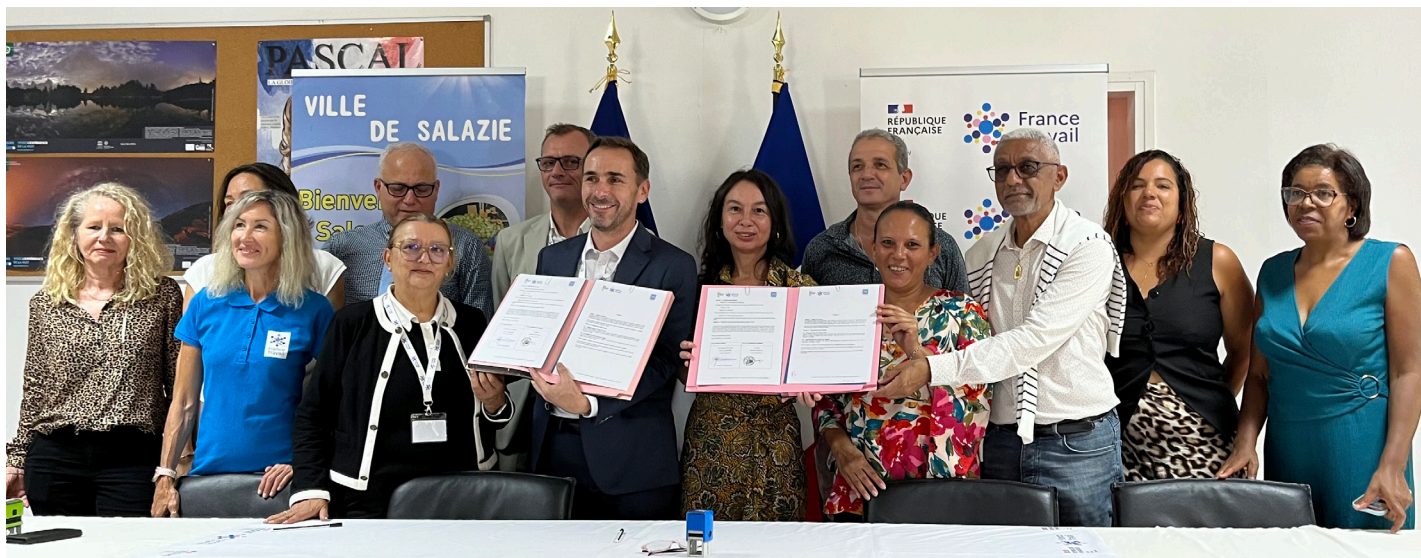
Signature historique de la convention de coopération entre France Travail et la commune de Salazie, scellant un partenariat stratégique pour l'emploi sur notre territoire.

Le 11 avril dernier, Salazie a incarné une ambition forte : faire de l'emploi une priorité territoriale. À l'occasion de la semaine du soin et de l'accompagnement, la commune a accueilli « La Place de l'Emploi ». Un grand rendez-vous, qui a réuni 300 visiteurs, étroitement organisé par la mairie de Salazie et France Travail, en partenariat avec le Conseil départemental, la CIREST et de nombreux acteurs de terrain.