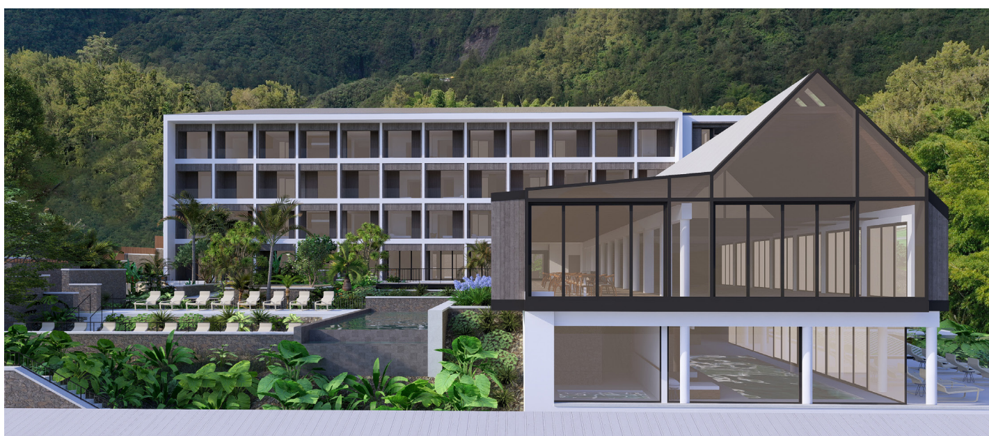
Les anciens bâtiments du RSMA vont être métamorphosés pour laisser place à un nouvel établissement hôtelier au cœur de Hell-Bourg.

À la faveur d'un appel à projets lancé en 2022, Hell-Bourg s'apprête à accueillir un hôtel d'exception.