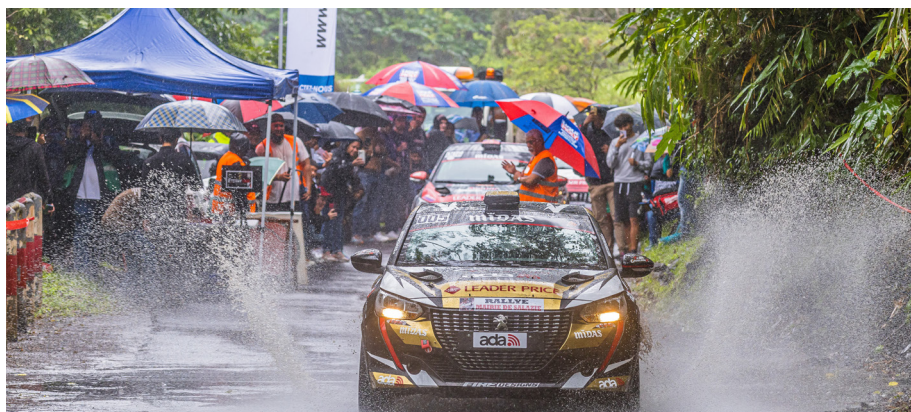
Premier rallye régional de Salazie • Crédit photo : Tony D'Ambreville Photographie Break TV Sport.

Le samedi 22 juin dernier, l'ASA 974 a écrit une page dans l'histoire du sport automobile réunionnais en organisant le tout premier rallye régional de Salazie.