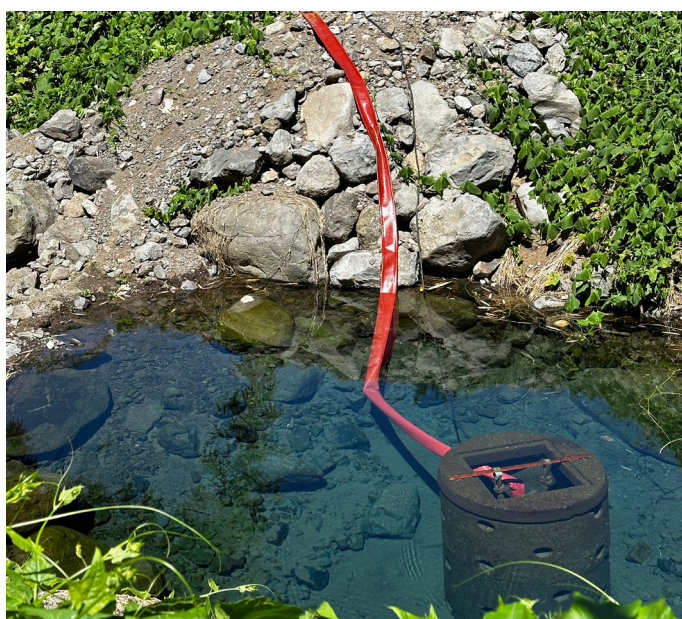
Captage de secours de Mathurin créé fin 2023 • Il est sollicité en période de sécheresse lorsque les débits ne sont pas assez forts pour maintenir le service.

Depuis son élection, Sidoleine PAPAYA, a fait de la gestion de l'eau potable une priorité majeure de son mandat.