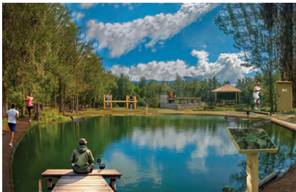
Place Maurice Payet : Projet PIVE financé par la CIREST et l'UE par le biais du FEDER - travaux estimés à 400 000€