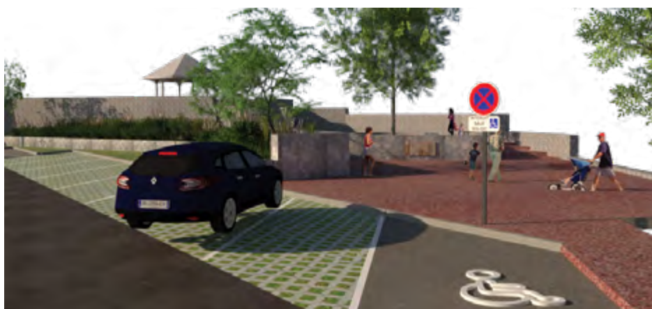
Place Roland Elisabeth (aire de pique-nique en face du CASE) : Projet PIVE financé par la CIREST et l'UE par le biais du FEDER - travaux estimés à 900 000€