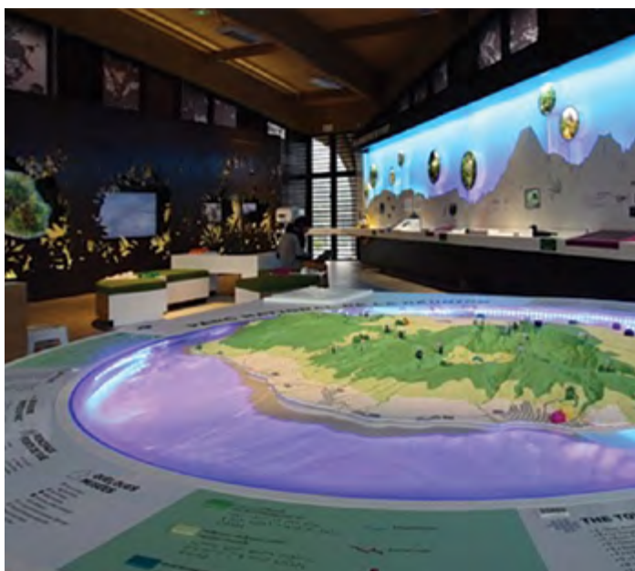
« Nout projet de territoire » couvre tous les domaines du quotidien

Et si l'on imaginait ensemble Salazie dans 15 ans ? C'est ce que la commune a lancé avec « Nout projet de territoire » : une feuille de route pensée avec les habitants, pour faire aux défis du quotidien et dessiner un avenir ambitieux, solidaire et responsable. Voici les grandes lignes de ce projet collectif.