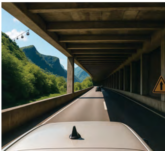
Extrait du diagnostic porté par le CEREMA, pour un projet visant à désenclaver le cirque.

En parallèle, une attention particulière est portée afin de soutenir l'agriculture : aider à l'acquisition de citernes de stockage d'eau, mettre en place un tarif différencié d'eau brute, favoriser le développement de la transformation, l'agro-tourisme, l'agro-foresterie, l'agri-voltaïques, et les circuits courts dans les cantines et restaurants du cirque, soutenir la valorisation des déchets en biomasse, créer un périmètre d'irrigation par Ilêt en mixant avec des retenues collinaires, préserver et valoriser les terres agricoles et en friches avec une souplesse en zone rouge, structurer la filière Chouchou.