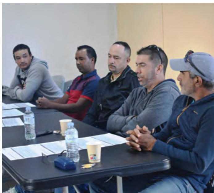
Les ateliers participatifs ont eu lieu avec de nombreux acteurs du territoire

« N out projet de territoire », c'est plus qu'un slogan : c'est une méthode, un engagement, un projet de territoire co-construit avec les Salaziennes et Salaziens. En 2024, la commune a lancé une grande démarche participative pour poser une question simple, mais essentielle : à quoi voulons-nous que ressemble notre territoire dans quinze ans ? La réponse a été collective.