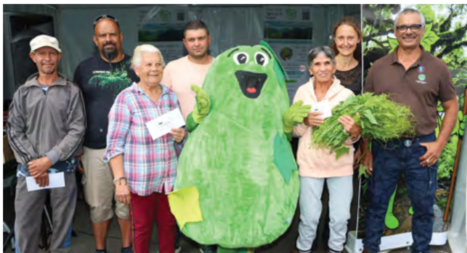
Nos heureux gagnants du concours « Casseurs de brèdes chouchou »

Texte de l'opposition non réceptionné dans les délais impartis.