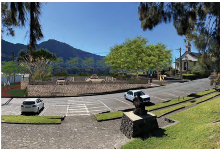
Place Maximin Maillot : Projet PIVE financé par la CIREST et l'UE par le biais du FEDER - travaux estimés à 450 000€

C'est à proximité de l'église de Saint Martin, au cœur symbolique du village de Grand-Ilet, que des actions viendront embellir ce cadre apaisé. Le projet prévoit l'aménagement d'un parking, la requalification de l'allée centrale par un revêtement qualitatif, un sol uniforme avec un alliage en basalte et un sol en béton drainant, des barrières amovibles, la création d'un escalier dans l'axe de l'église pour rejoindre la partie basse avec une placette de rencontre où des bancs seront installés et la fontaine réhabilitée.